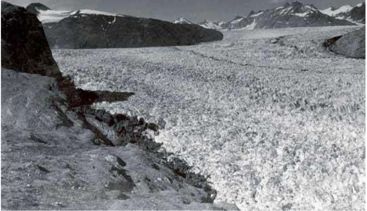
Opción B. Figura 2